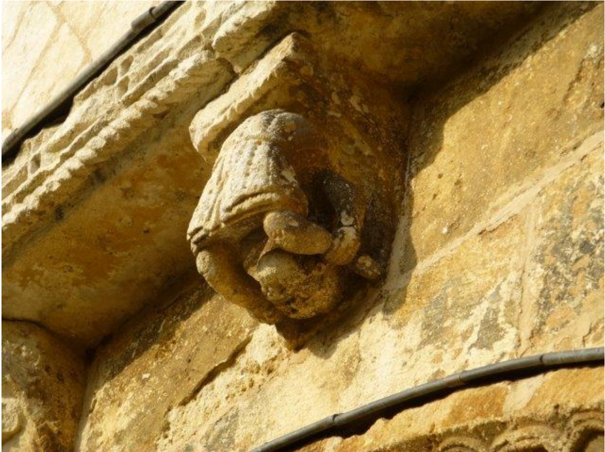
Portail de l'église de Besse